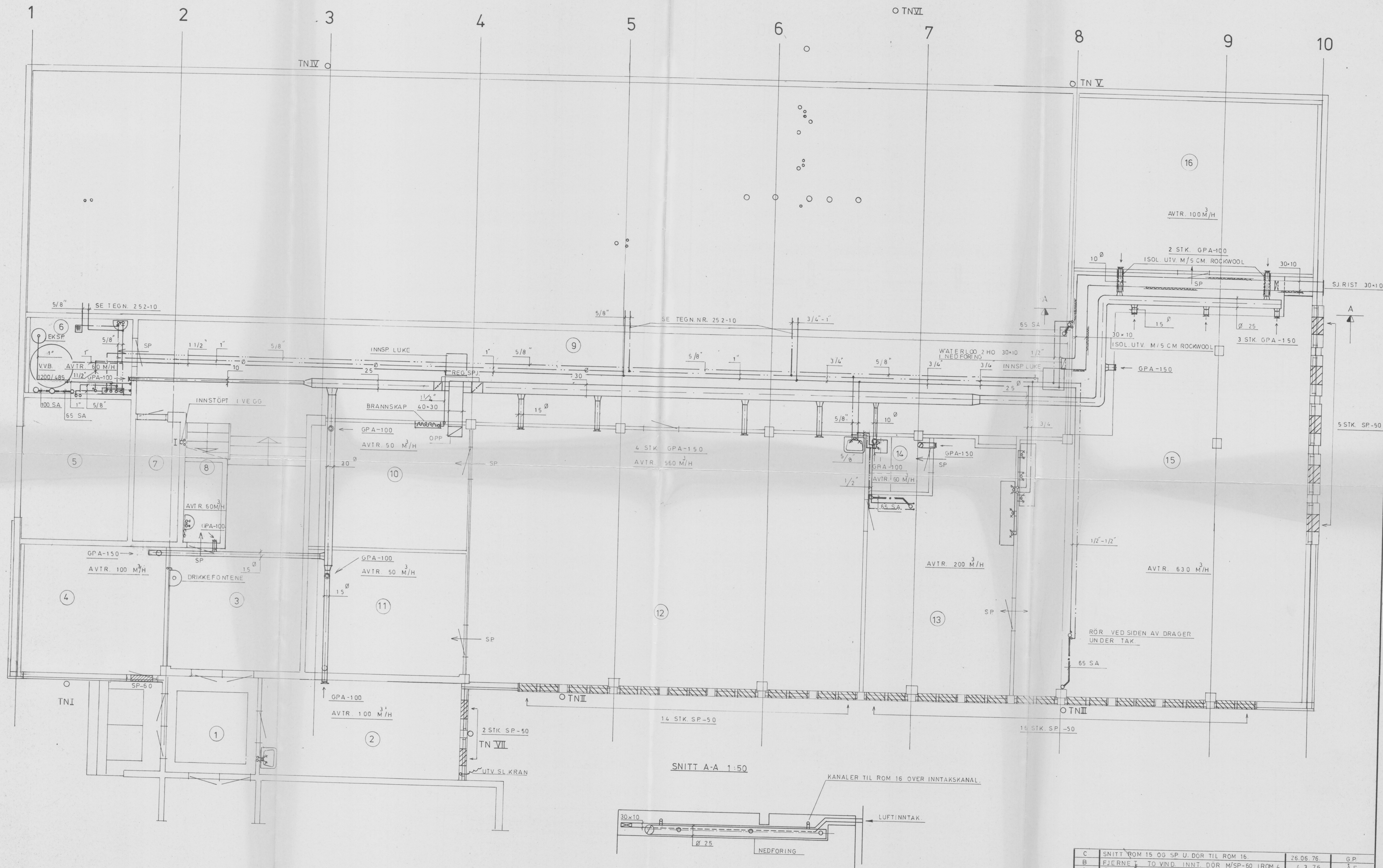
SNITT A-A 1:50